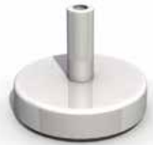
Aluminiumsockel lackierter Aluminiumdeckel, bis zu 25 kg mit Sand zu füllen.